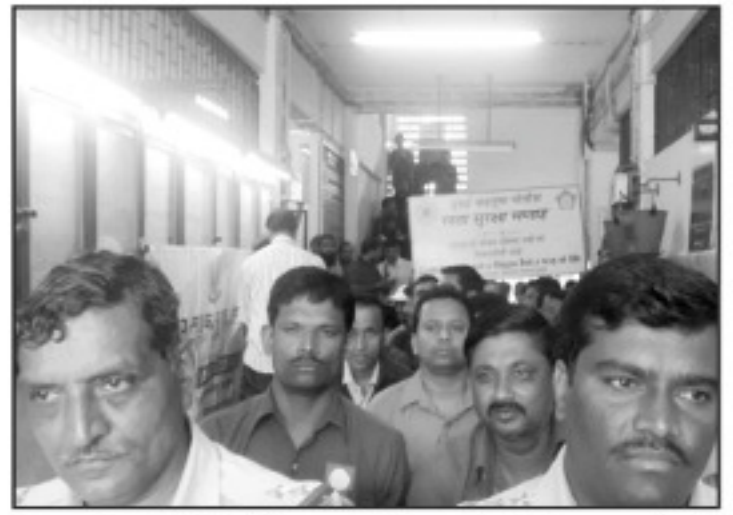
मालाड : येथील बेस्टच्या कंडक्टर्स व ड्रायव्हर्ससाठी आयोजित आध्यात्मिक कार्यक्रमात सहभागी स्टाफ व अधिकारी